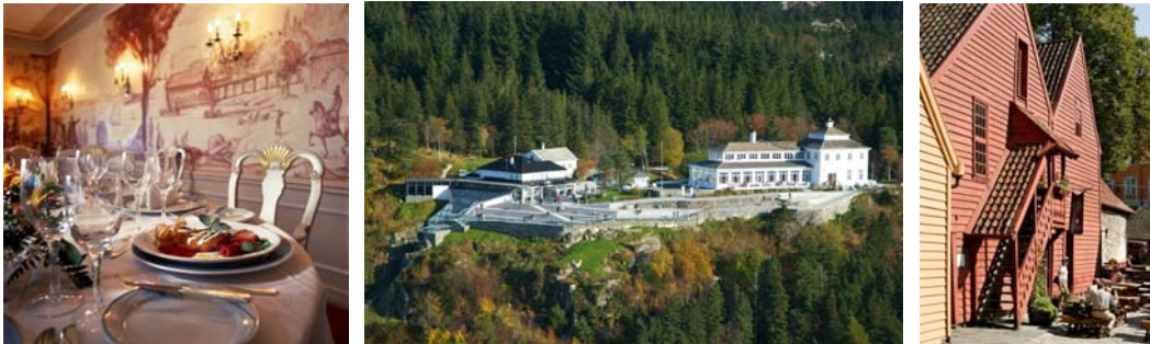
Foto: Lyststedet Bellevue, Fløien Folkerestaurant, Bryggen Tracteursted