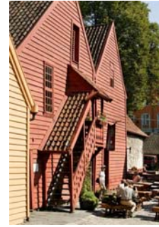
Foto: Lyststedet Bellevue, Fløien Folkerestaurant, Bryggen Tracteursted