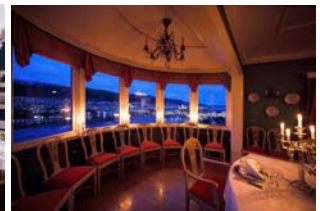
Foto: Lyststedet Bellevue, Blåsalen og Storstuen